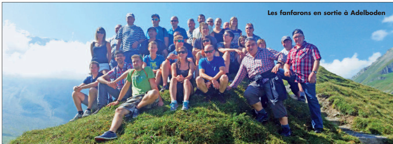
Les fanfarons en sortie à Adelboden