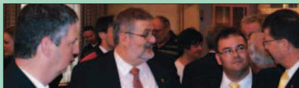
Ca discute ferme entre comités vaudois et fribourgeois à l'apéro