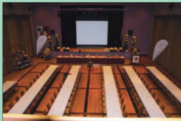
La superbe salle de la Maison Pulliérane