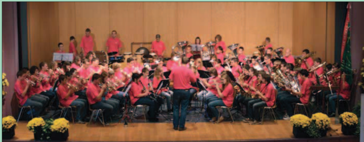
Le camp musical de la région de Lavaux lors de sa prestation