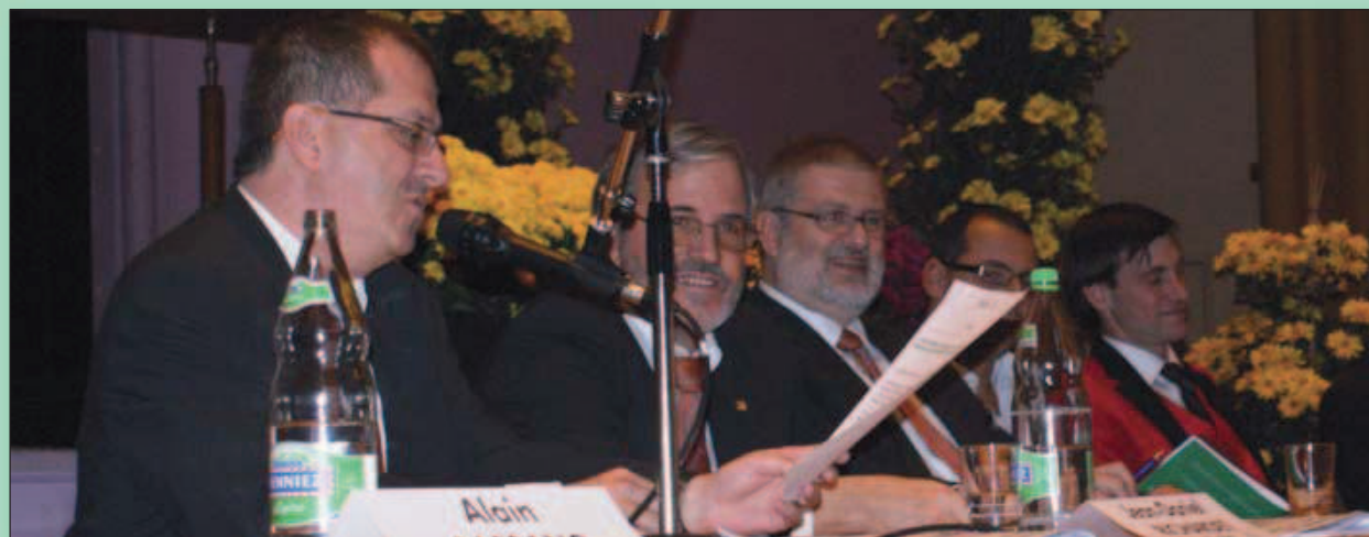
Qu'est-ce qui peut bien faire sourire le comité central?