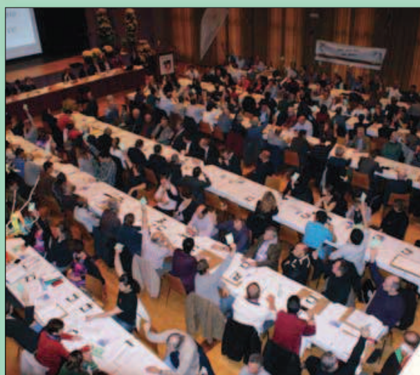
L'assemblée en plein vote