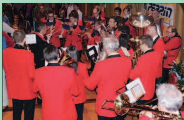
Le Corps de Musique de Pully, avec ses uniformes flambants neufs