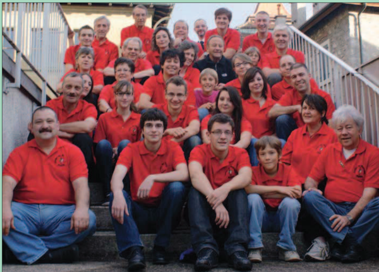
La société organisatrice