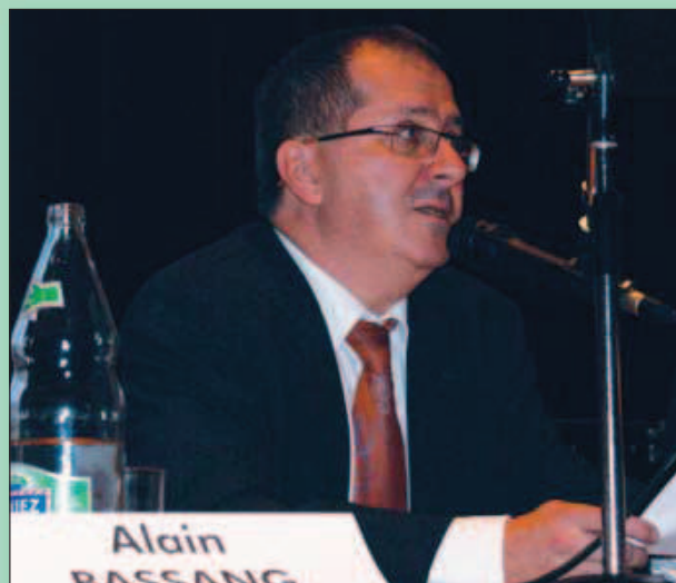
Le président en plein travail