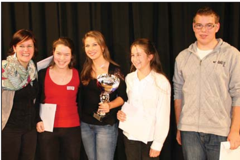
super finale bois