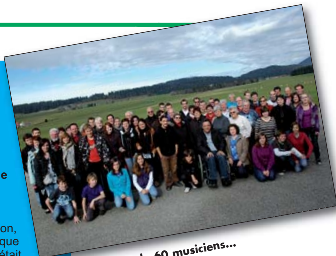
Plus de 60 musiciens...