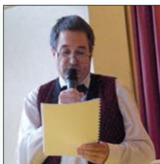
La lecture des comptes