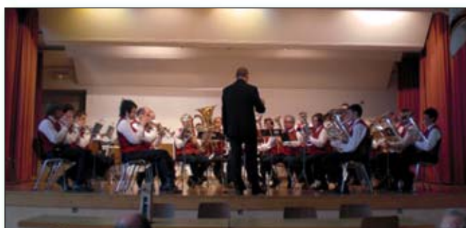
La société de Saint-Maurice