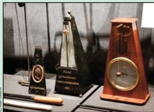
Métronomes datant de 1815