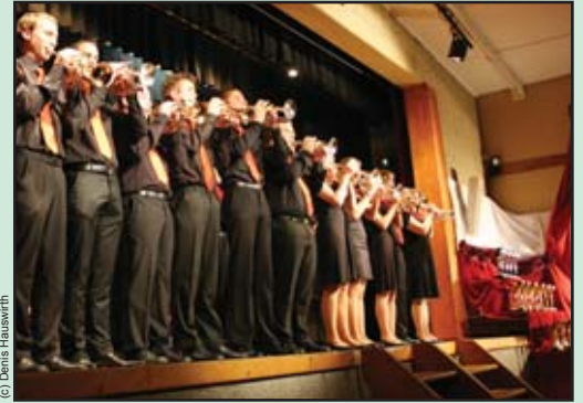
l'entrée en musique de Mélodia Junior dans une salle comble