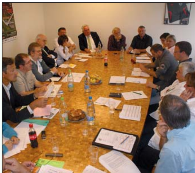
Les délégués en discussion