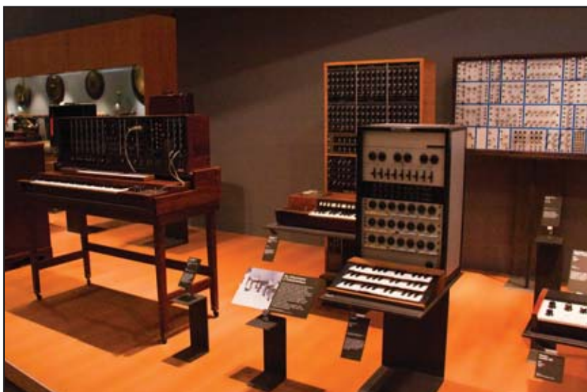
Instruments du XXème siècle

métro: ligne 5, direction Bobigny – Pablo Picasso, sortir station Porte de Pantin