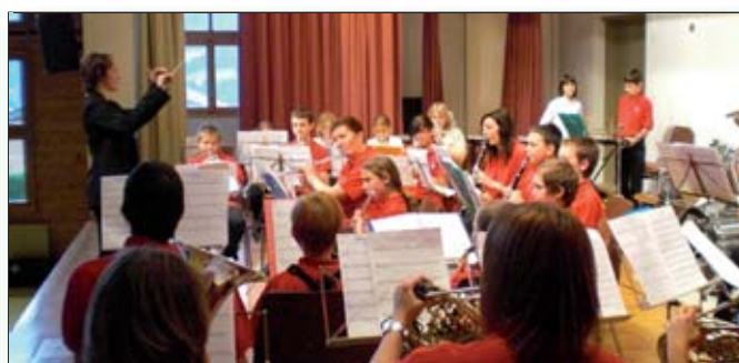
L'association des écoles de musique de Gryon-Bex