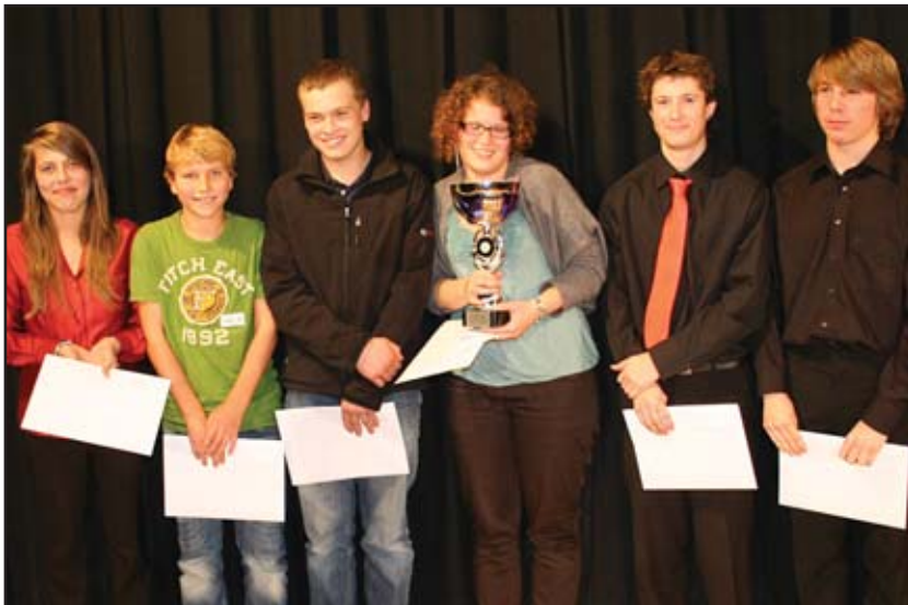
super finale cuivres