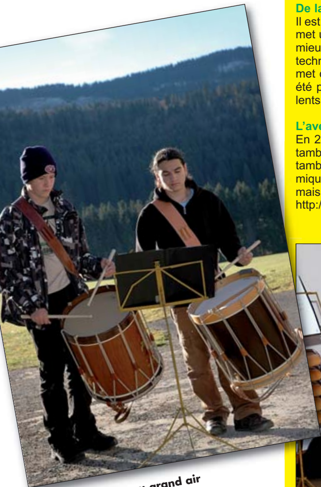
Entraînement au grand air

En 2011 un nouveau camp a été prévu du 23 au 29 octobre et est ouvert aux tambours de tout âge, qui ont trois ans de pratique de l'instrument et, pour les tambours, qui savent au moins faire un roulement et ont une connaissance rythmique. Ils pourront découvrir que les tambours ne font pas que des marches, mais aussi des compositions intéressantes et nouvelles. Site du camp : http://avenir.educanet2.ch/cmnb MKurth