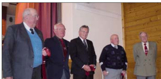
Les membres d'honneur de l'association