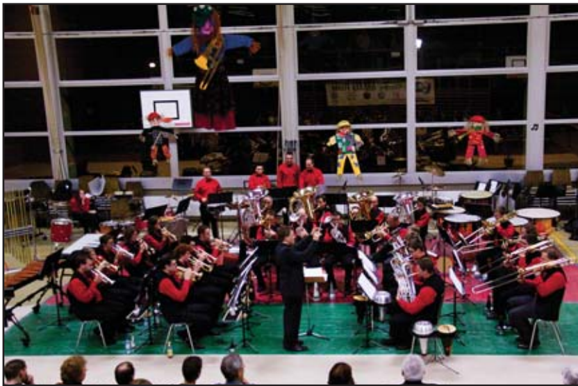
Concert d'ouverture par Mélodia Junior et Mélodia (sur la photo)