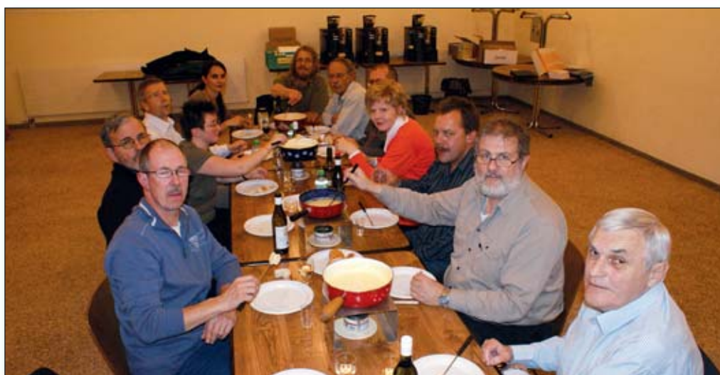
Les comités d'Aclens et de la SCMV

Ces rencontres instaurées bien avant mon arrivée au comité donnent l'occasion à chacun de s'exprimer sur les hauts et les bas de nos fanfares. Cette année n'a pas failli à la tradition et le comité de l'Avenir d'Aclens avait tout mis en œuvre pour que ce moment festif se déroule dans les meilleures condi-