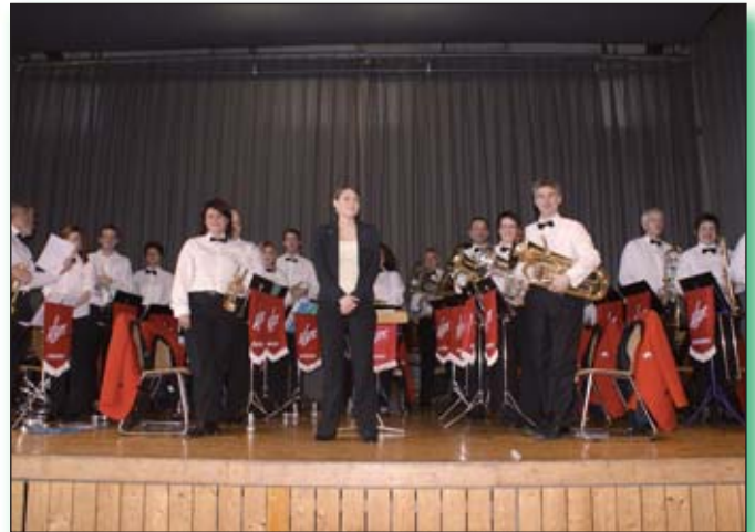
La Lyre de Busigny à la fin de son concert