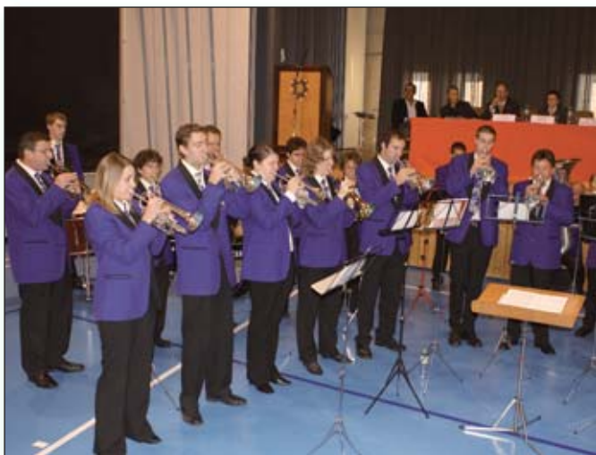
Les «petits chants» de l'Avenir d'Aclens