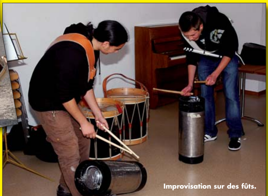
Improvisation sur des fûts.