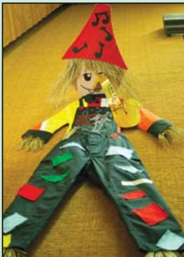
La pianiste de Nyon