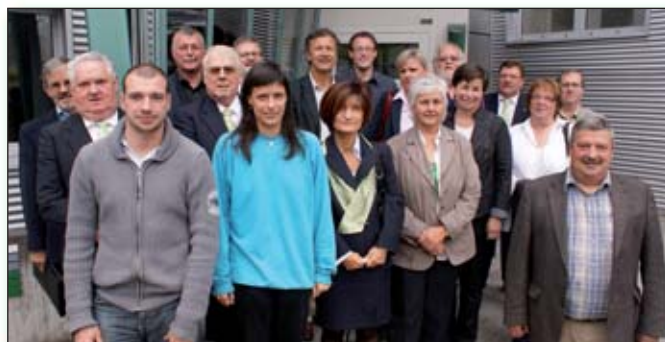
Les participants au terme des débats