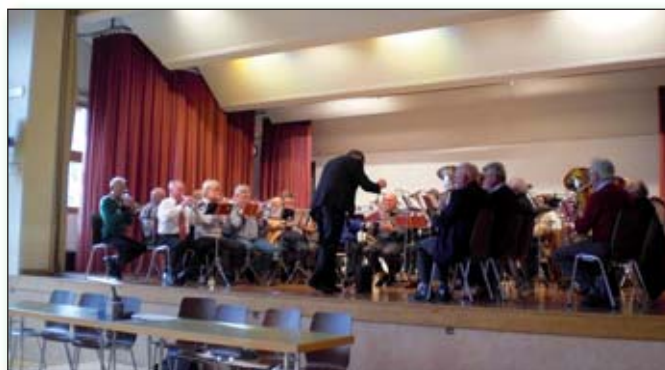
La fanfare des vétérans vaudois

Aucunes modifications à l'ordre du jour n'étant demandées, la parole est donnée à