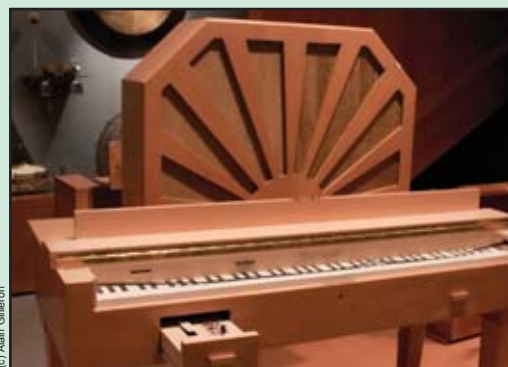
Les ondes Martenot