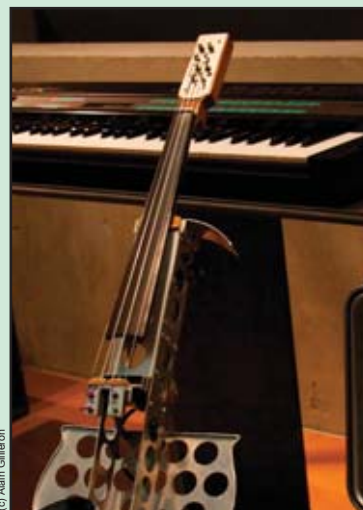
Violon électronique construit par l'IRCAM.

La fanfare de Gimel vous convie à son repas de soutien qui aura lieu le