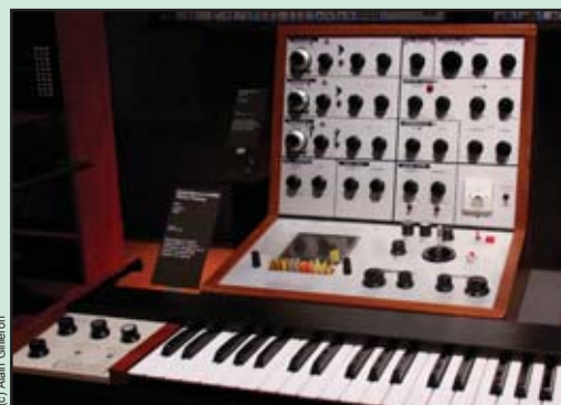
Le mythique EMS VCS3