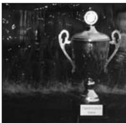
La Coupe prend un bain de pieds dans la fontaine du KKL...