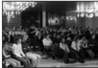
...lors de la finale