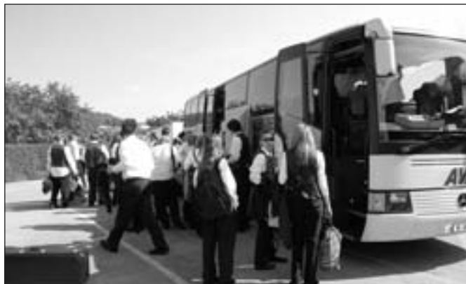
Départ pour un grand moment...