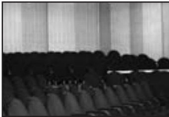
le public lors de la journée...