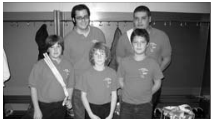
La batterie de la fanfare de Pomy.