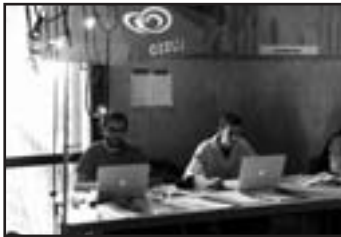
Notre magnifique stand