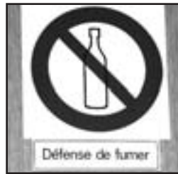
... après ça on dit qu'on a mauvaise réputation...