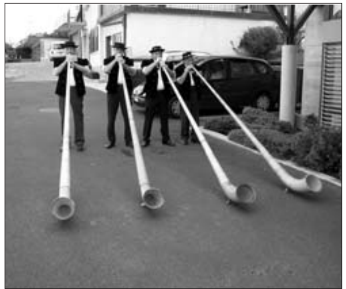
Un groupe de cors des Alpes nous a fait le plaisir d'être parmi nous.