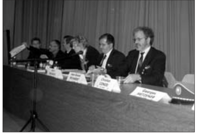
Le comité de la SCMV.

tenu en haleine les délégués jusqu'à midi quinze. Relevons quelques points importants des débats. En premier lieu, le Président annonça la démission de l'Union Instrumentale de Morges pour arrêt d'activité portant ainsi l'effectif de la SCMV à 107 sociétés. Dans son rapport, il poussa un coup de gueule remarqué à l'intention des 18 sociétés absentes dont trois n'étaient même pas excusées précisant que c'était souvent ces mêmes sociétés qui ne respectaient pas les délais. Ensuite et dans l'ordre, les délégués ont entendu un brillant