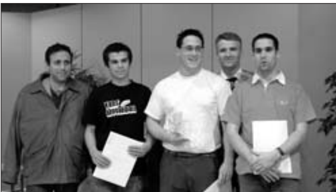
Les finalistes, catégorie tambours.