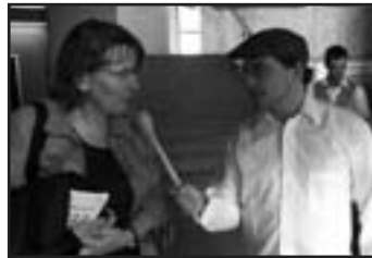
des interviews de choc!