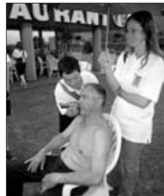
Le président de la CEM en a même perdu sa moustache!