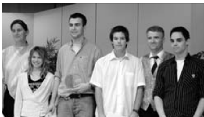
Les finalistes, instruments à vent / bois.