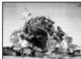
La triste fin d'une fleur décorative au bord de la scène