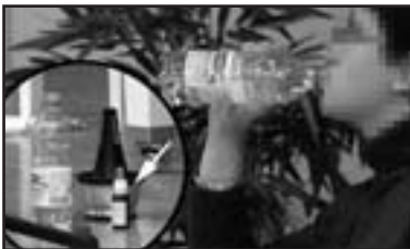
du dopage dans le milieu de la musique