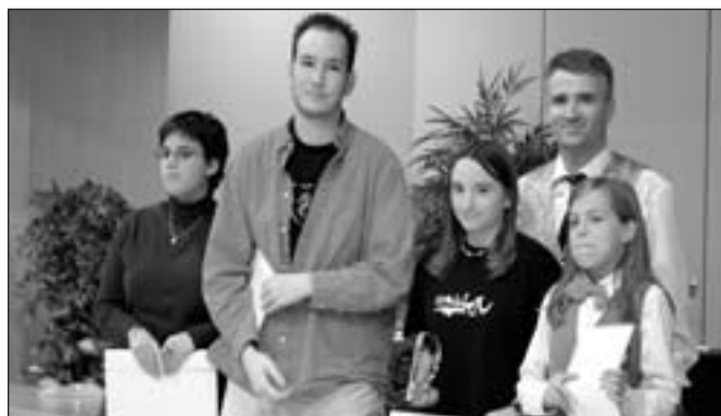
Les finalistes, instruments à vent / cuivres.