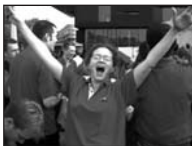
Explosion de joie