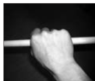
Tenue de la baguette: main droite.