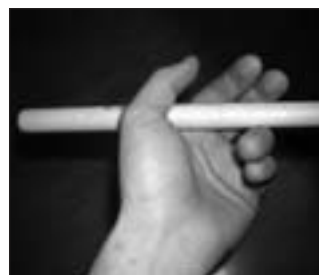
Tenue de la baguette: main gauche.

La première chose que l'on apprend se sont les positions des mains et la tenue des baguettes. Pour chaque main, la tenue est différente. Pour la main gauche: le poignet est à l'envers, la baguette passe entre l'annulaire et le majeur et elle repose dans le creux du pouce. Pour la main droite: la baguette est tenue dans la paume de la main le poignet à l'endroit. Tous les doigts sont en contact avec la baguette, mais sans pression sur celle-ci.