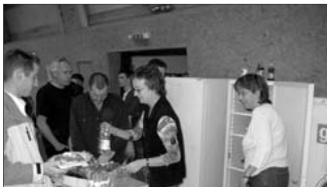
Merci aux bénévoles...