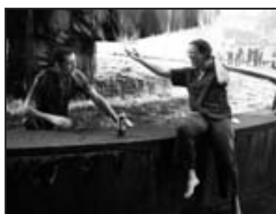
...le Cornet répiano aussi!