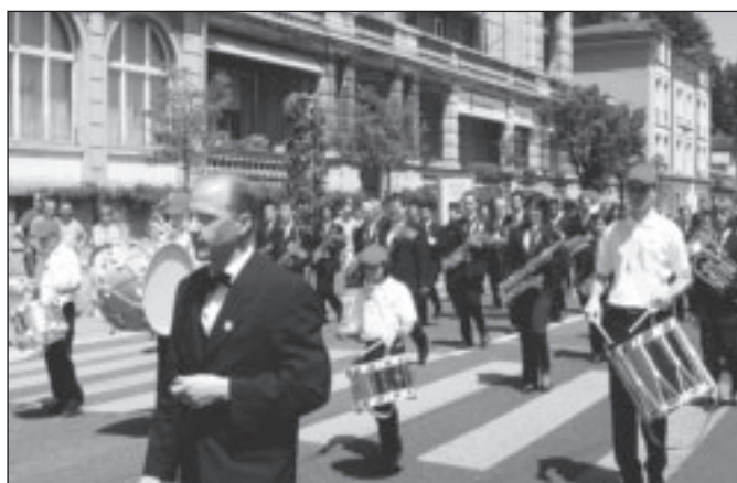
L'Harmonie Lausannoise avant son concours de marche.