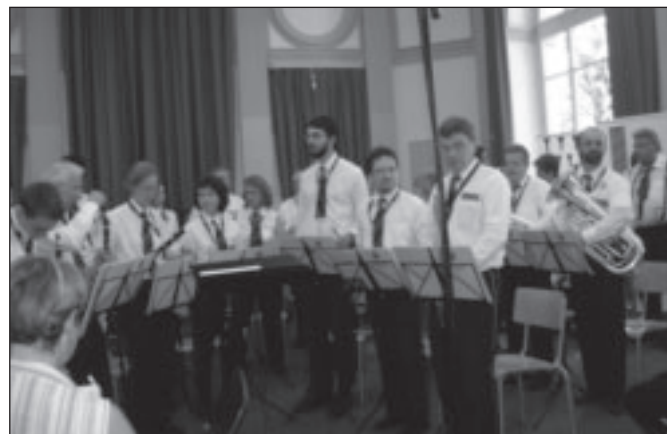
L'Union instrumentale de Prilly en salle de concours.