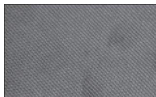
La peau tressée.