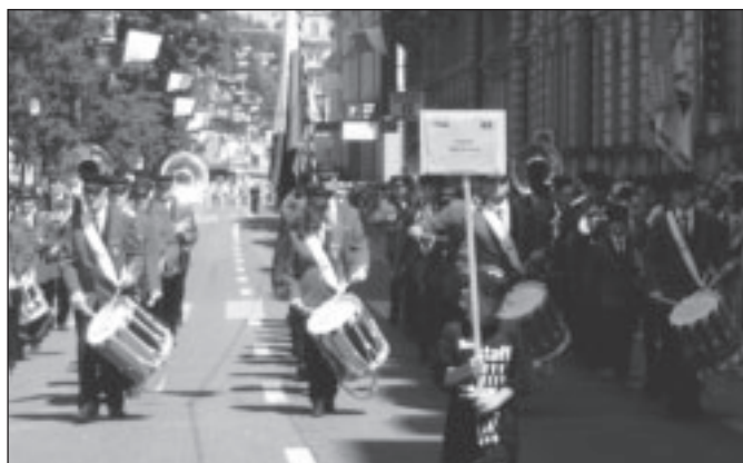
Une bonne idée, le drapeau vaudois au milieu de ceux de Gilly et Bursins.