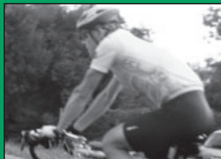
Le maillot jaune de l'étape Chexbres-Les Paccots