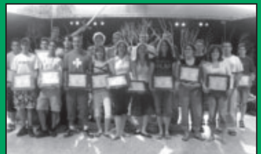
Les Diplômés du 25ème Camps