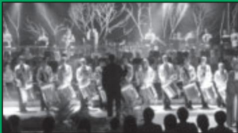
La Fameuse marche