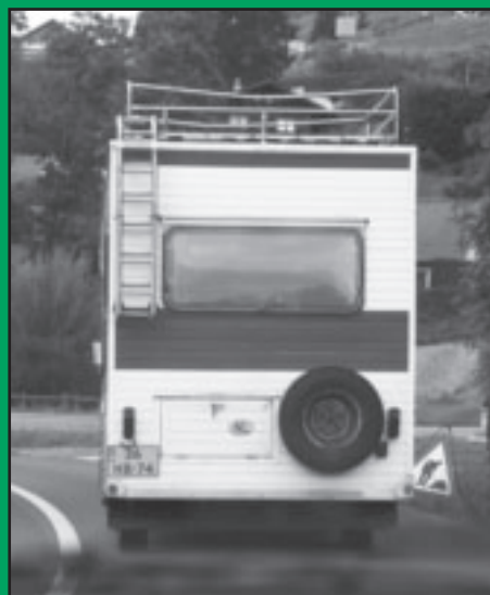
Le fameux camping car hollandais