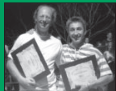
Des Diplômés désormais VIP