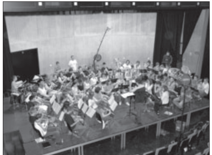
L'ensemble lors de l'enregistrement.