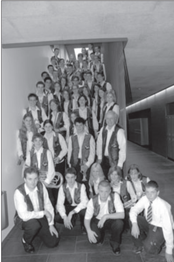
L'Ensemble des jeunes instrumentistes de la Broye (EJIB)