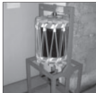
Un tambour mis sous presse.