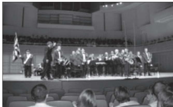
La fanfare municipale de Mont-sur-Rolle au KKL.