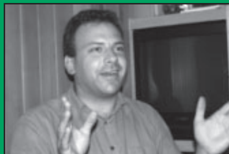
Le projet était comme ça!