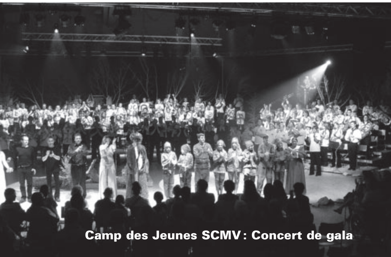
Camp des Jeunes SCMV : Concert de gala

ORGANE OFFICIEL DE LA SOCIÉTÉ CANTONALE DES MUSIQUES VAUDOISES