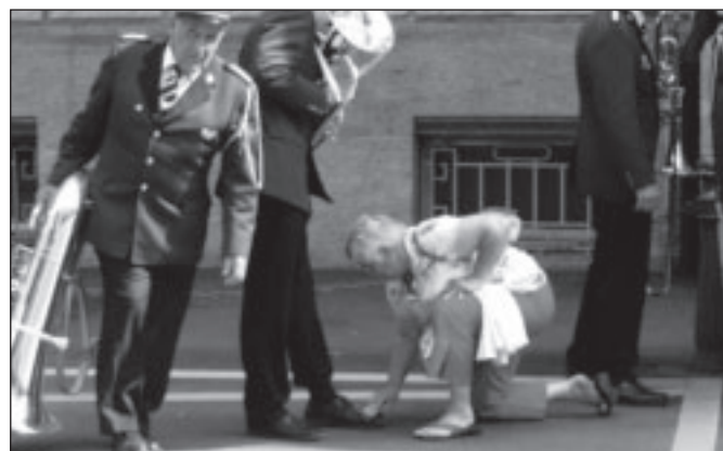
Une supportrice de Concise cire les souliers au départ de concours de marche.