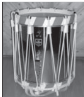
Tambours bâlois 40.