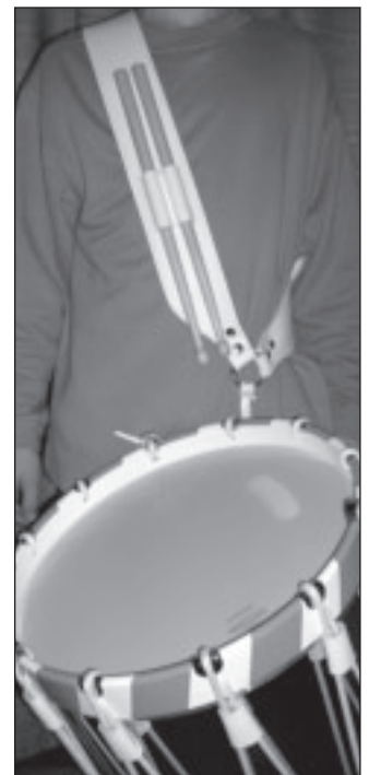
Position du baudrier et du tambour.