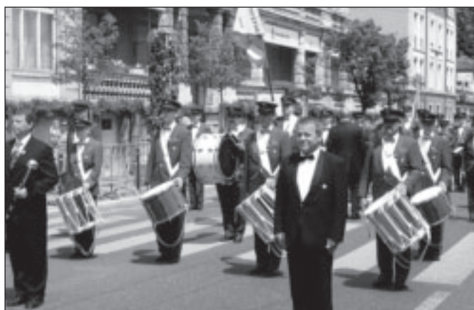
L'avenir de Payerne prête au départ.

nos harmonies, fanfares et brass bands, nous nous référons à l'article très complet publié dans le journal Unisso du 14 juillet 2006. Quant aux photos publiées ci-après, elles ont été prises, sur le vif, par le président cantonal et le responsable du journal. JHZ