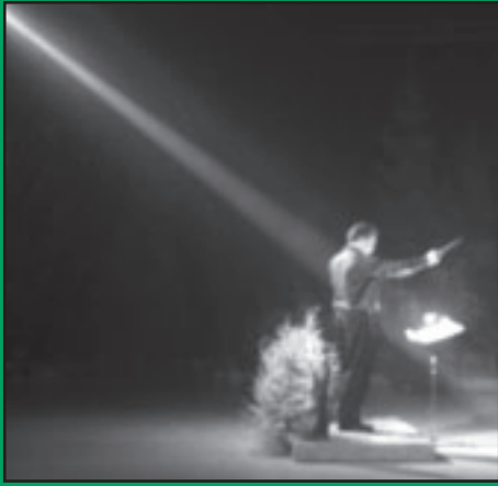
Le Chef en action!