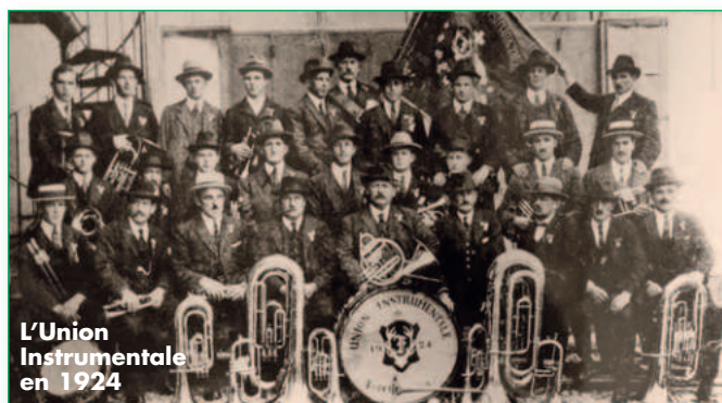
L'Union Instrumentale en 1924

En 2019, nous avons choisis de mettre en musique cette histoire incroyable en confiant la composition des pièces à Théo Schmitt, jeune compositeur émérite connu de notre région et reconnu, également, au-delà de celle-ci. Tout devait être prêt pour notre centième anniversaire en 2021, une pandémie plus tard, nous avons pu accueillir notre public et pré-