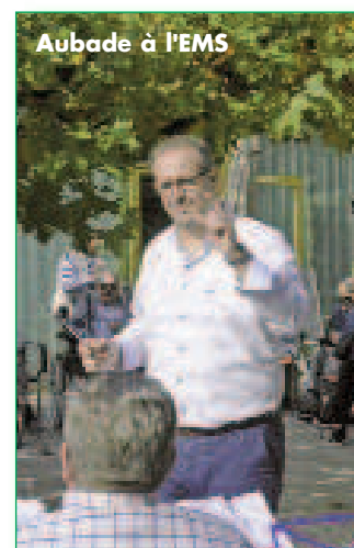
Aubade à l'EMS