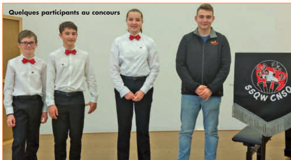
Quelques participants au concours

Un bon outil pour la progression et la motivation. Les élèves sont souvent plus motivés à travailler à la maison avec un tel objectif. De plus, c'est aussi l'occasion d'écouter d'autres musiciens, de faire des rencontres ou de revoir des