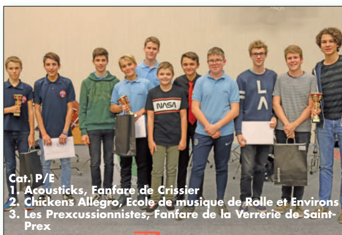
Cat. P/E 1. Acousticks, Fanfare de Crissier 2. Chickens Allegro, Ecole de musique de Rolle et Environs 3. Les Precussionnistes, Fanfare de la Verrerie de Saint-Prex