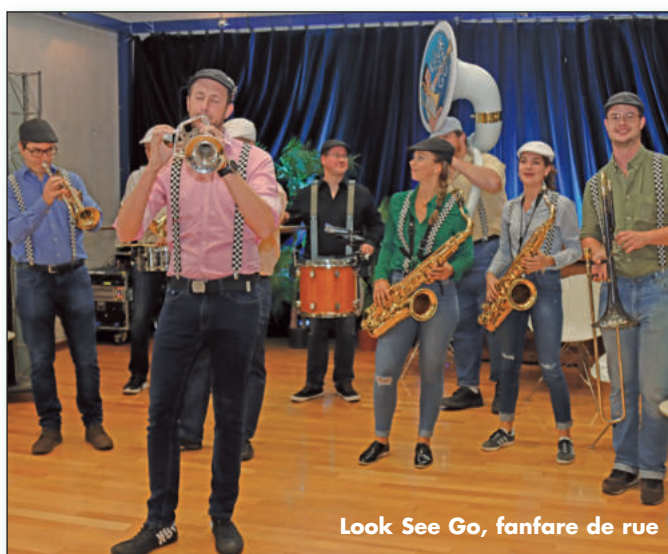
Look See Go, fanfare de rue