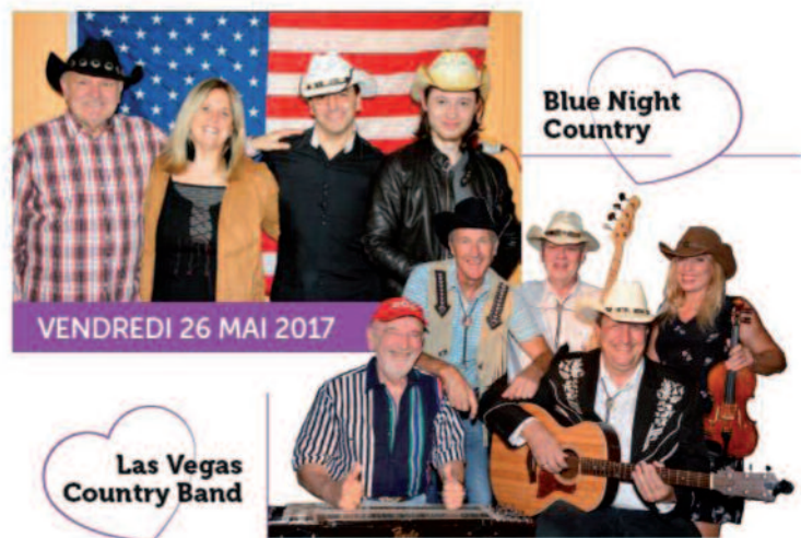
Les deux ensembles de la soirée Country du vendredi