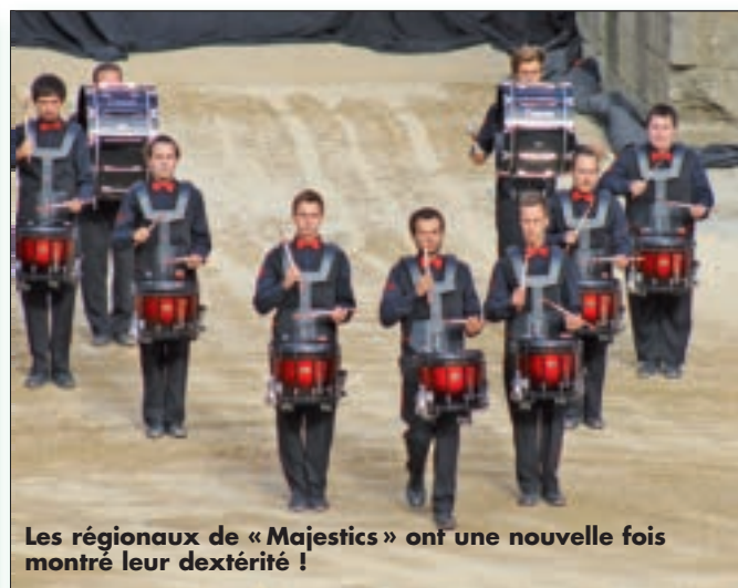
Les régionaux de «Majestics» ont une nouvelle fois montré leur dextérité !