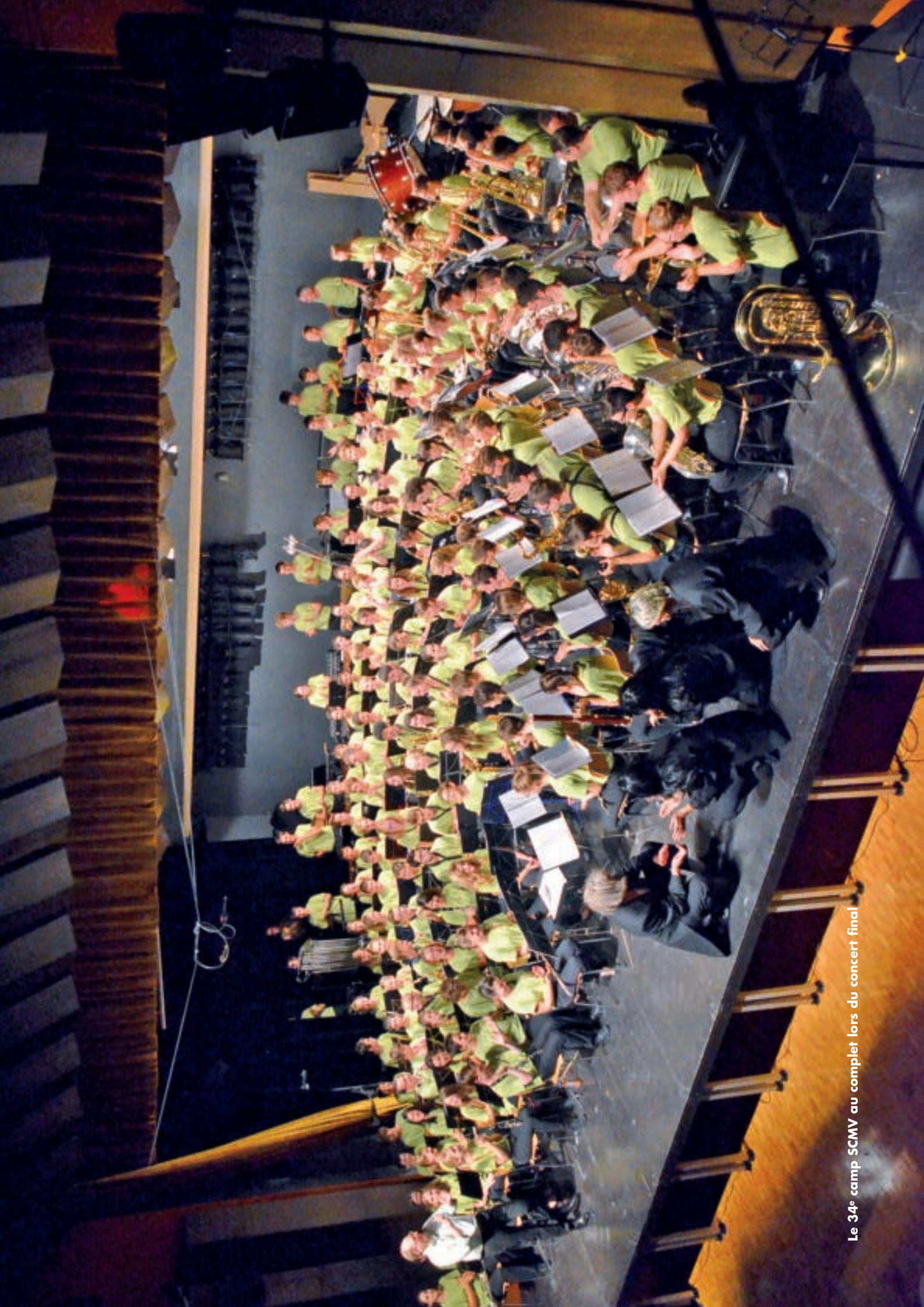
Le 34 e camp SCMV au complet lors du concert final