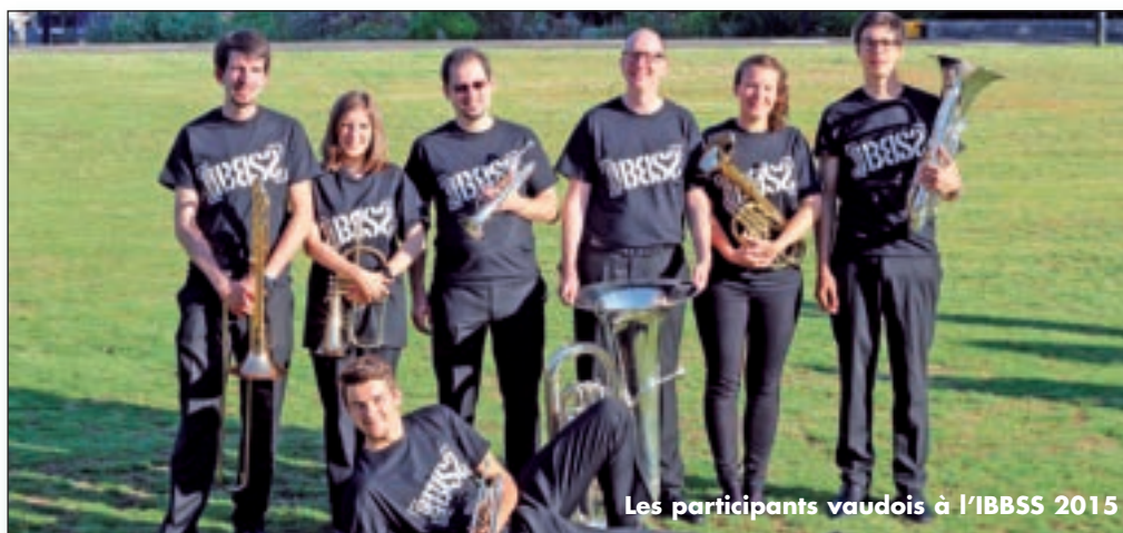
Les participants vaudois à l'IBSS 2015

A Swansea, une ville du pays de Galles, dans une université délaissée par ses étudiants le temps de la pause estivale, a lieu chaque année un rassemblement des plus extraordinaires: l'International Brass Band Summer School (IBSS). L'événement, qui fêtait cette année sa 25 e édition du 2 au 8 août, rassemble pendant une semaine des passionnés de musique de cuivres, encadrés par les plus grands noms des Brass Bands anglais.