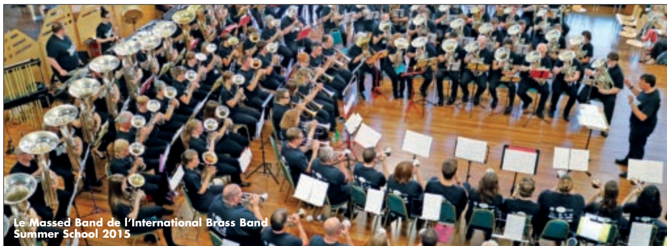
Le Massed Band de l'International Brass Band Summer School 2015