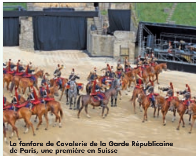
La fanfare de Cavalerie de la Garde Républicaine de Paris, une première en Suisse