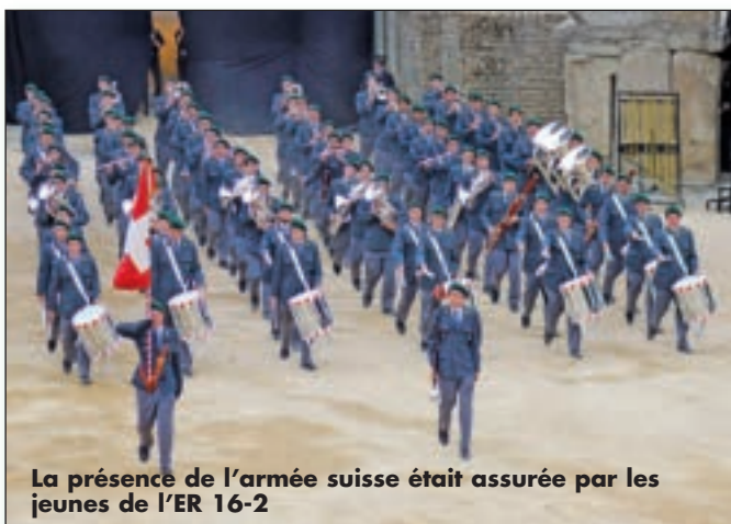
La présence de l'armée suisse était assurée par les jeunes de l'ER 16-2