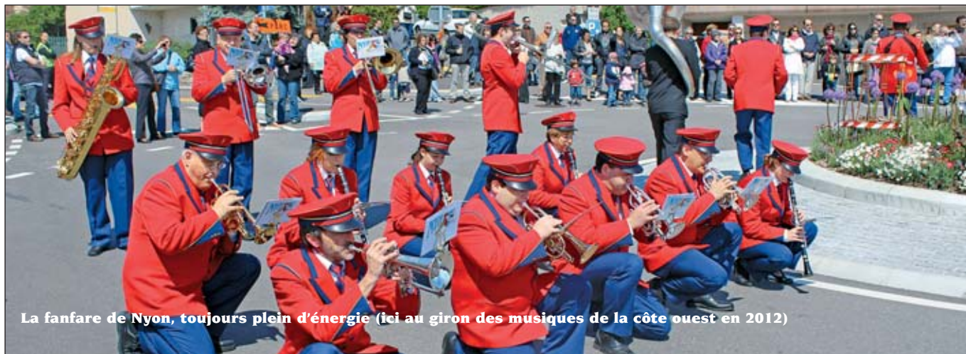
La fanfare de Nyon, toujours pleine d'énergie (ici au giron des musiques de la côte ouest en 2012)

UN SPECTACLE QUI SONDERA LES PROFONDEURS DÉLIRANTES DU LAC !