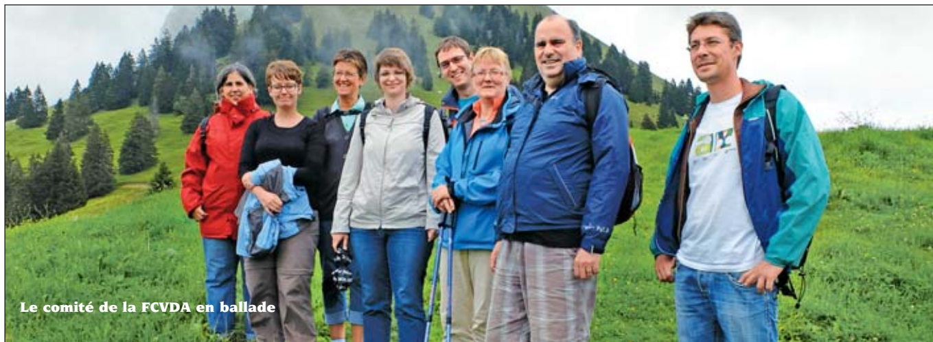
Le comité de la FCVDA en ballade