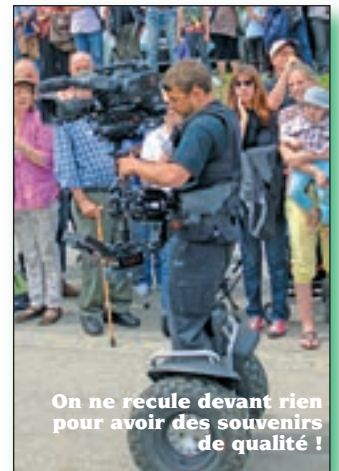
On ne recule devant rien pour avoir des souvenirs de qualité !