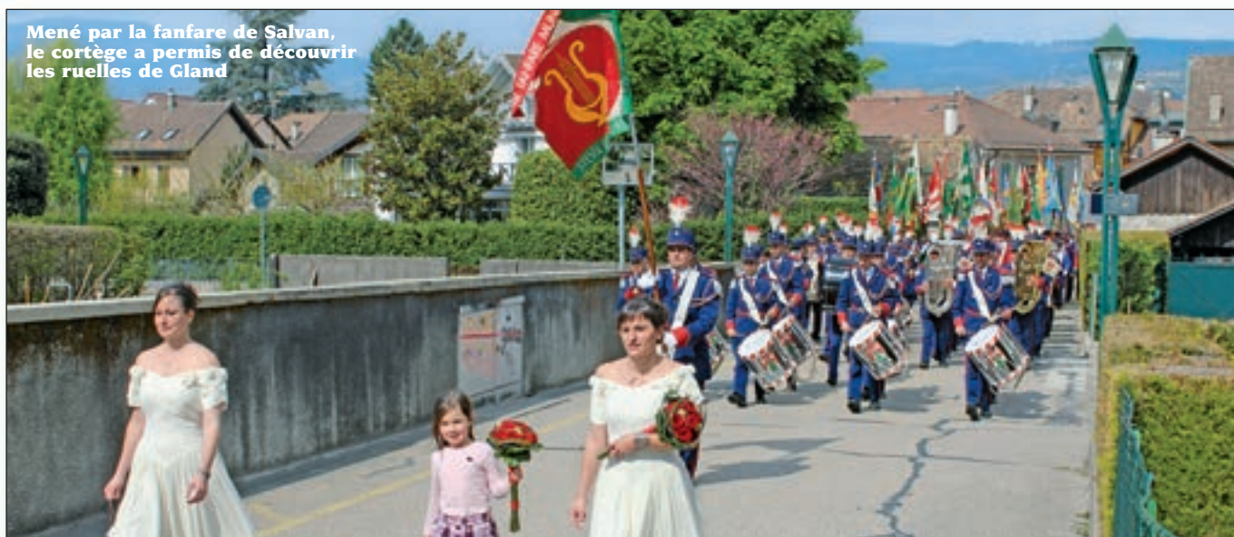
Mené par la fanfare de Salvan, le cortège a permis de découvrir les ruelles de Gland