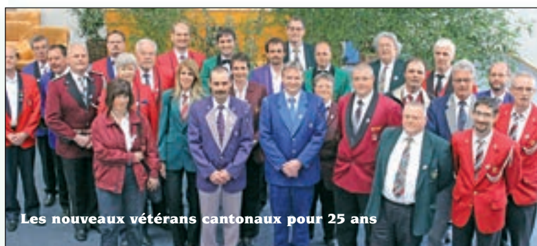
Les nouveaux vétérans cantonaux pour 25 ans