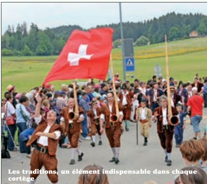
Les traditions, un élément indispensable dans chaque cortège