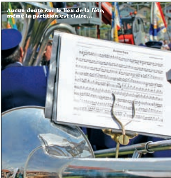
Aucun doute sur le lieu de la fête, même la partition est claire...