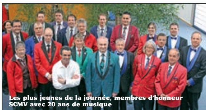
Les plus jeunes de la journée, membres d'honneur SCMV avec 20 ans de musique