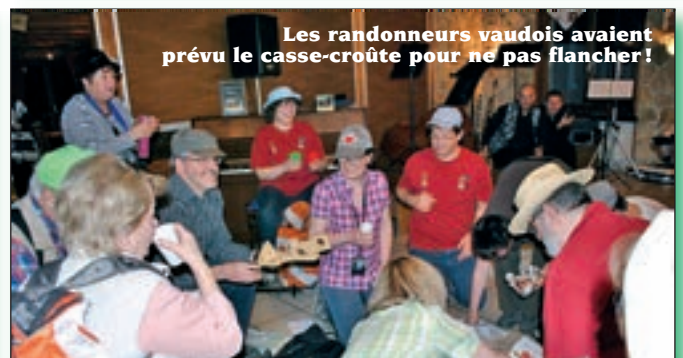
Les randonneurs vaudois avaient prévu le casse-croûte pour ne pas flancher!