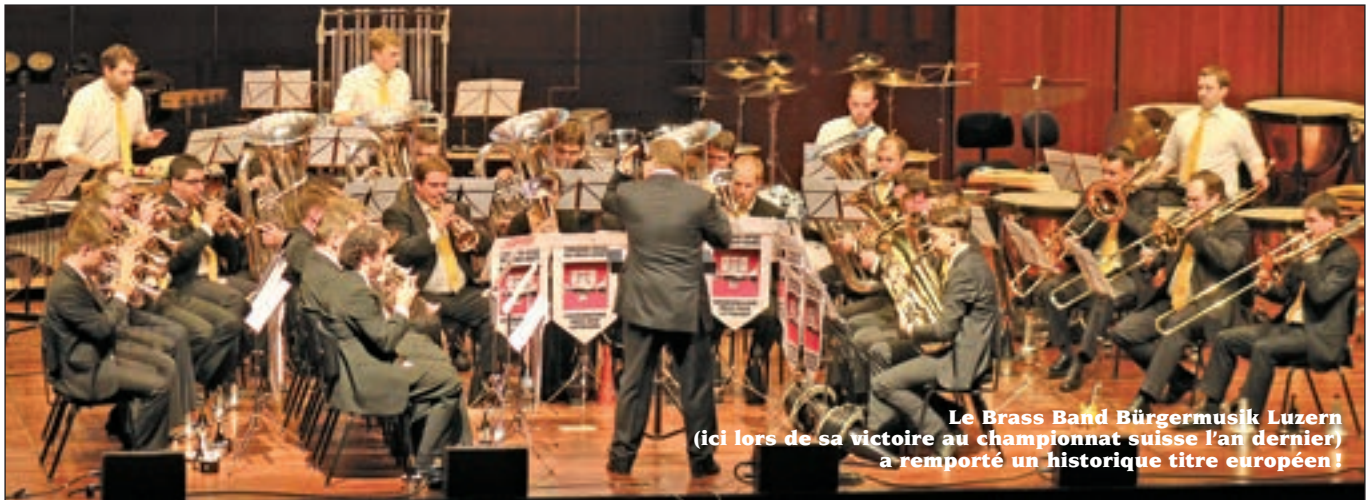
Le Brass Band Bürgermusik Luzern (ici lors de sa victoire au championnat suisse l'an dernier) a remporté un historique titre européen!