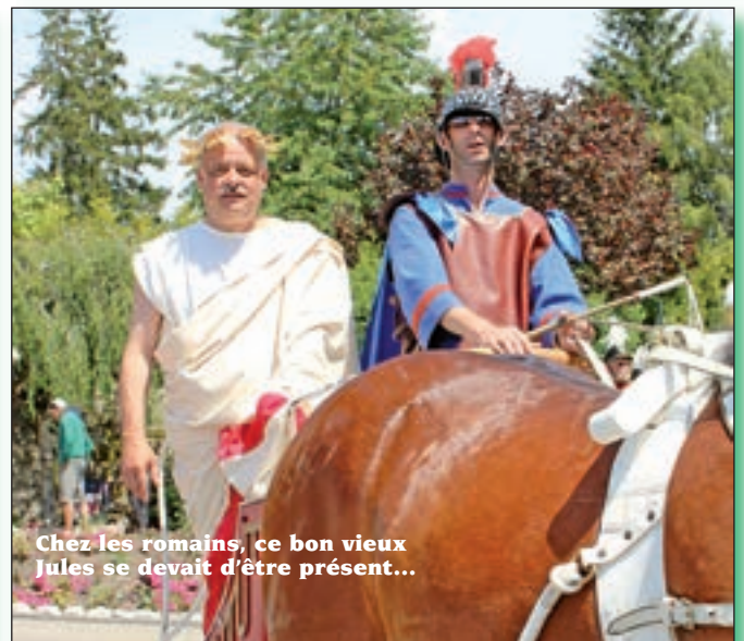
Chez les romains, ce bon vieux Jules se devait d'être présent...