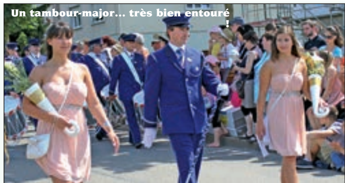
Un tambour-major... très bien entouré !