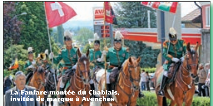
La Fanfare montée du Chablais, invitée de marque à Avenches