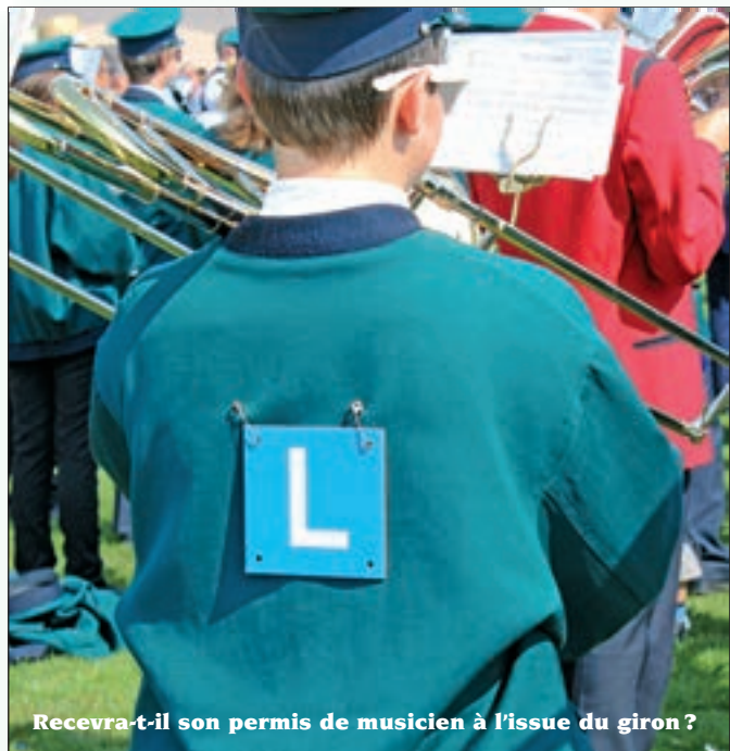
Recevra-t-il son permis de musicien à l'issue du giron ?