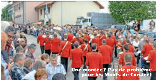
Une montée ? Pas de problème pour les Monts-de-Corsier !