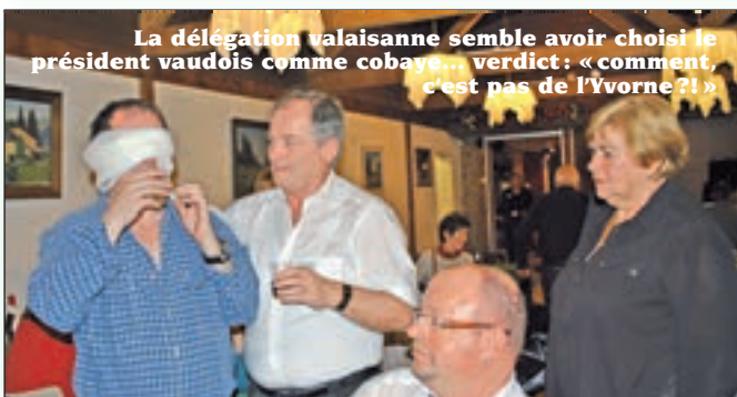
La délégation valaisanne semble avoir choisi le président vaudois comme cobaya... verdict: «comment, c'est pas de l'Yvorne?!»