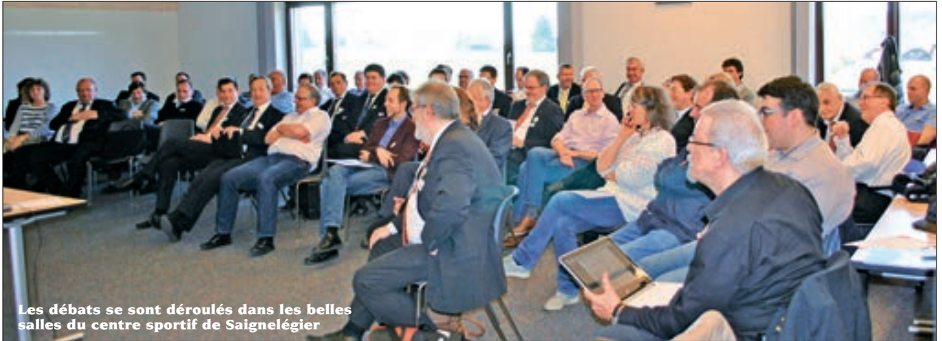
Les débats se sont déroulés dans les belles salles du centre sportif de Saignelégier