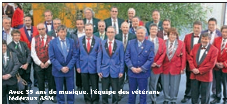
Avec 35 ans de musique, l'équipe des vétérans fédéraux ASM