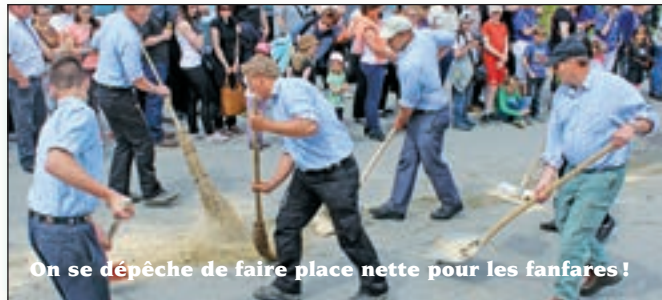
On se dépêche de faire place nette pour les fanfares !