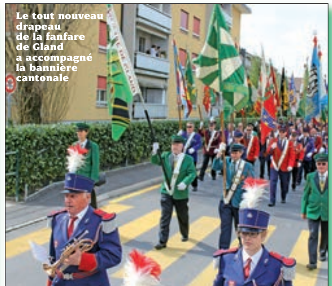
Le tout nouveau drapeau de la fanfare de Cland a accompagné la bannière cantonale