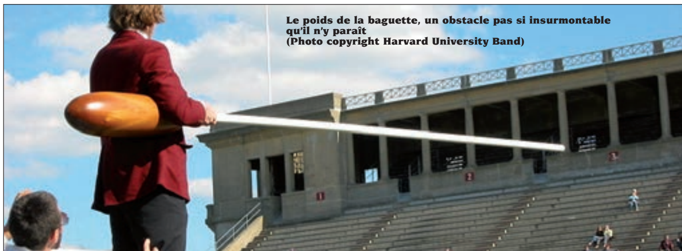
Le poids de la baguette, un obstacle pas si insurmontable qu'il n'y paraît