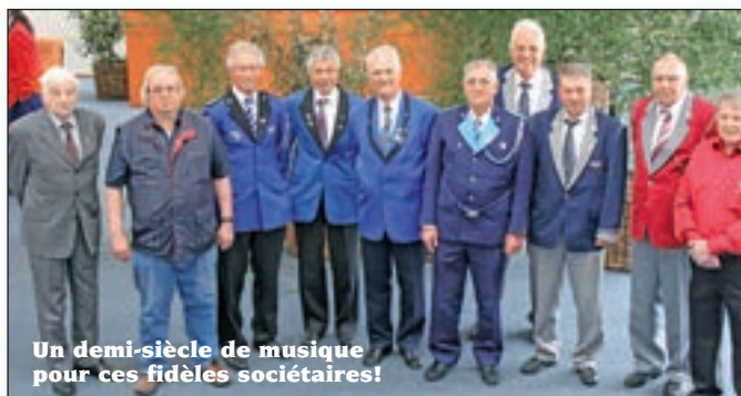
Un demi-siècle de musique pour ces fidèles sociétaires!