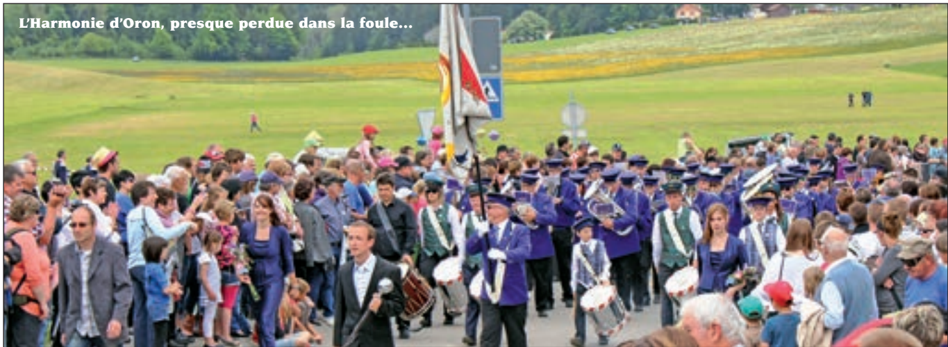
L'Harmonie d'Oron, presque perdue dans la foule...