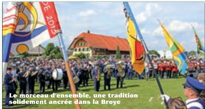
Le morceau d'ensemble, une tradition solidement ancrée dans la Broye