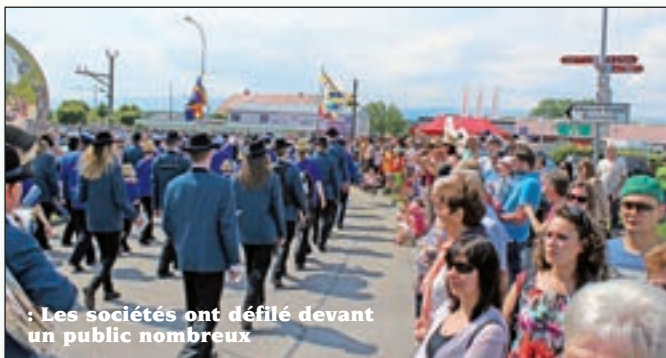
Les sociétés ont défilé devant un public nombreux