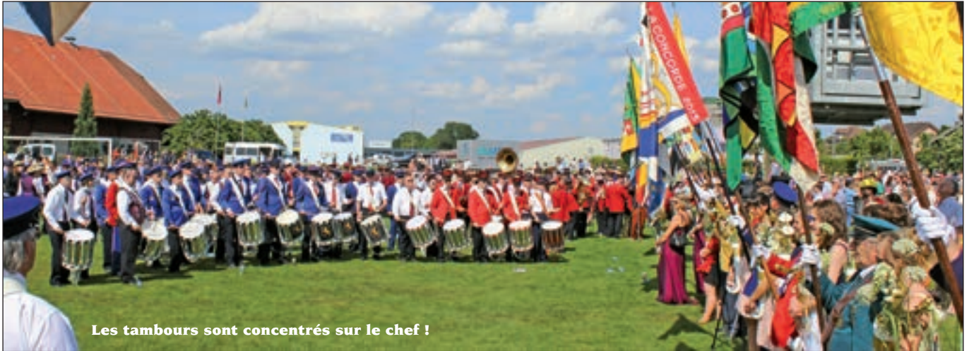
Les tambours sont concentrés sur le chef !