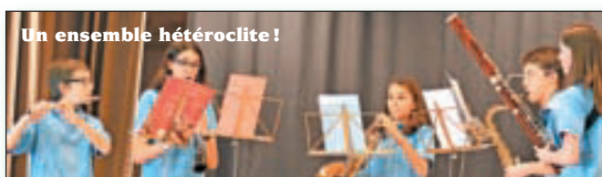
Un ensemble hétéroclite!

si à damner le pion aux «Percu T» d'Etoy. Chez les tambours et batterie anglaises enfin, victoires de l'Ecole de musique de Nyon, des Tapolets (Aclens) et des Etierruz (Etoy).