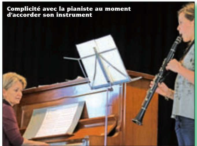
Complicité avec la pianiste au moment d'accorder son instrument

Lausanne) qui l'a emporté en junior et « Ben, Sax