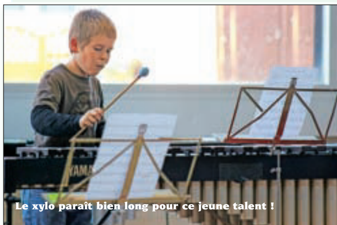
Le xylo paraît bien long pour ce jeune talent!