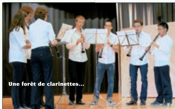
Une forêt de clarinettes...