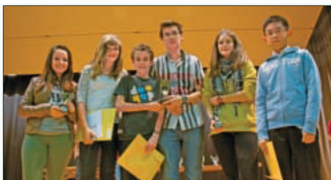
Cat. I/E : 1. Swing'ô'Sax (Avenir Belmont-sur-Lausanne) 2. Les Trois Bois (Echo du Chêne Pampigny) 3. The Clownsr-rit-net (Harmonie Municipale La Lyre Echallens)