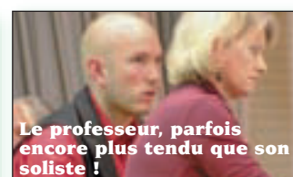
Le professeur, parfois encore plus tendu que son soliste!