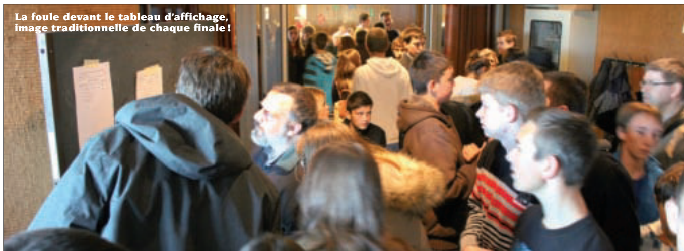
La foule devant le tableau d'affichage, image traditionnelle de chaque finale!

si à damner le pion aux «Percu T» d'Etoy. Chez les tambours et batterie anglaises enfin, victoires de l'Ecole de musique de Nyon, des Tapolets (Aclens) et des Etierruz (Etoy).