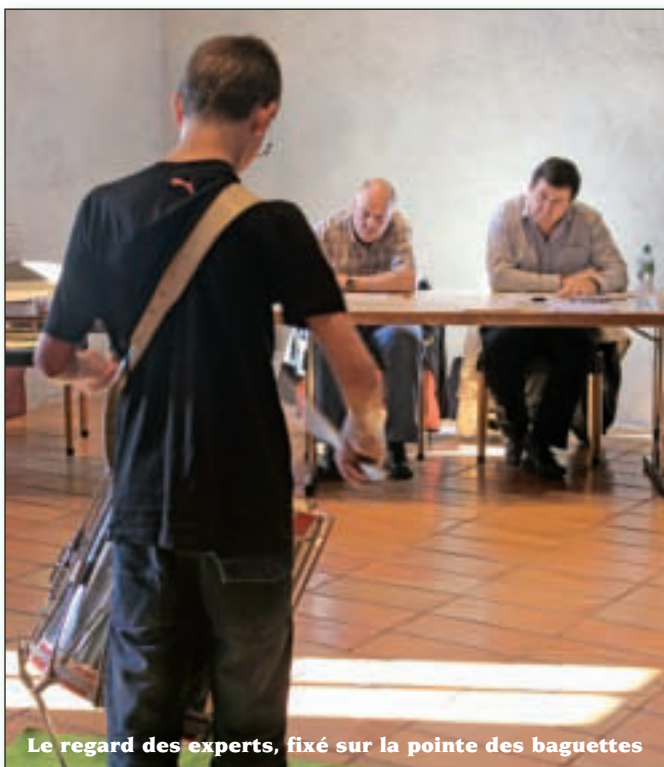
Le regard des experts, fixé sur la pointe des baguettes

Alors!» (Granges-près-Marnand) chez les seniors. Pour les percussions, les « bras cassés » de Crissier ont réus-