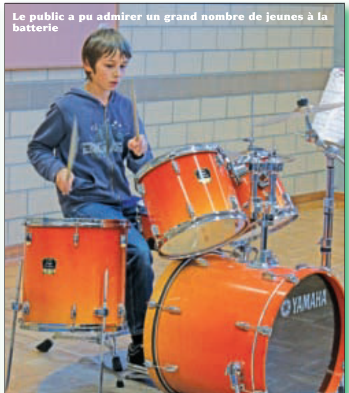
Le public a pu admirer un grand nombre de jeunes à la batterie