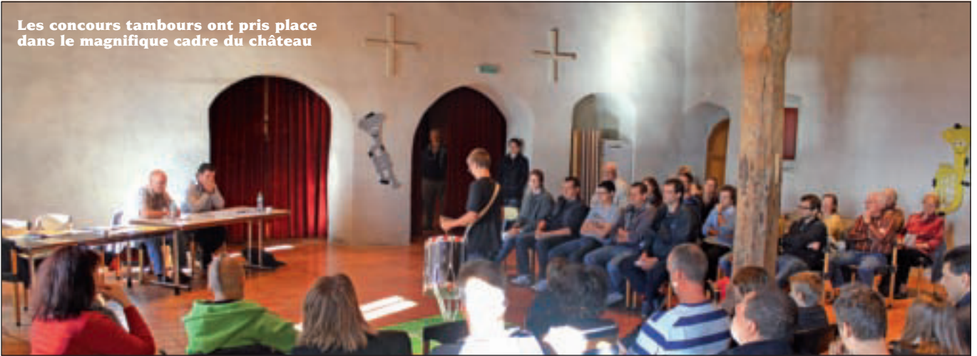
Les concours tambours ont pris place dans le magnifique cadre du château