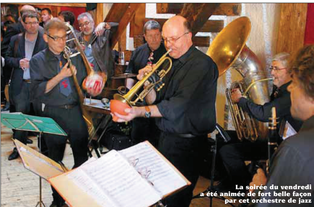
La soirée du vendredi a été animée de fort belle façon par cet orchestre de jazz

sur sol vaudois devenir réalité. Relevons encore que la candidature Montreux-Riviera 2016 est portée par 6 sociétés : la Fanfare de Chardonne-Jongy, la Société de Musique de St-Légier, La Lyre-Harmonie Municipale de Vevey, la Fanfare de l'Automne de Blonay, l'Echo des Alpes de Glion et le Corps de Musique Montreux-Clarens. En outre, tous les syndics des communes concernées par cet événement étaient également présents.