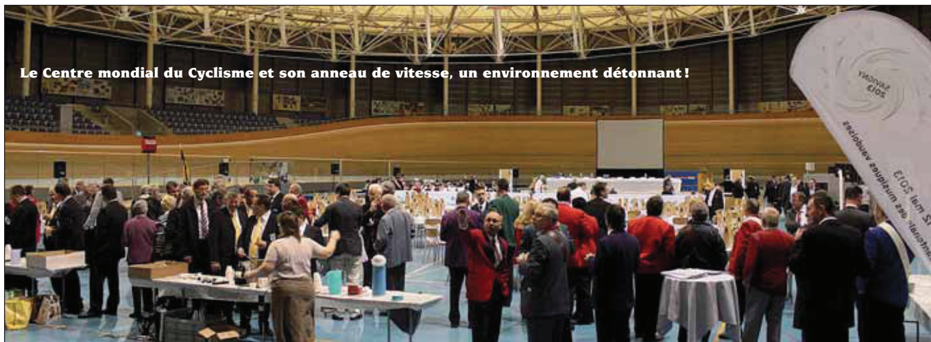
Le Centre mondial du Cyclisme et son anneau de vitesse, un environnement détonnant !