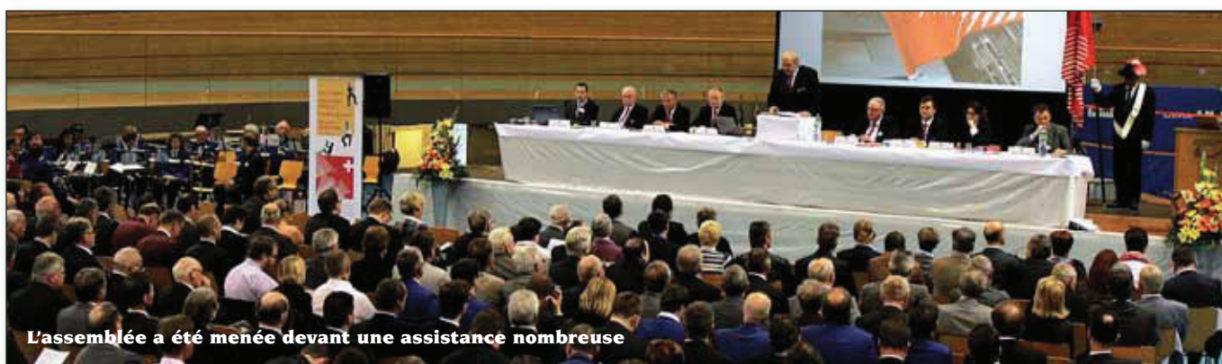
L'assemblée a été menée devant une assistance nombreuse

Un immense MERCI à toutes celles et ceux qui ont contribué au succès de la candidature Montreux-Riviera 2016, en la soutenant d'une quelconque manière !