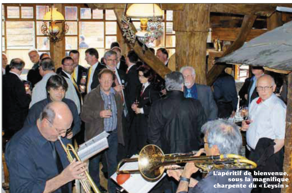
L'apéritif de bienvenue, sous la magnifique charpente du « Leysin »