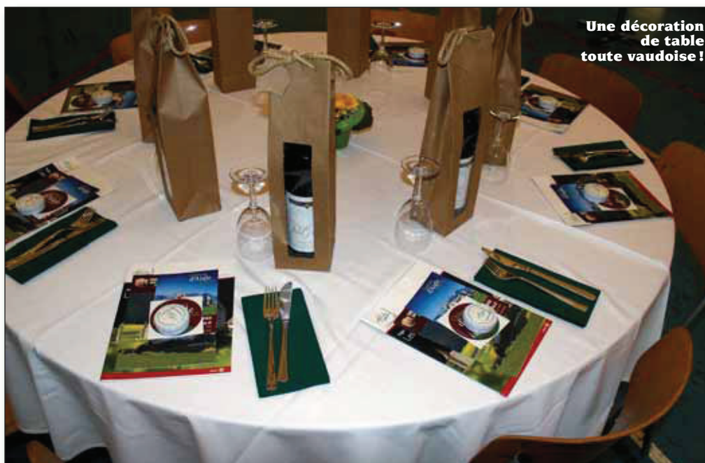
Une décoration de table toute vaudoise !