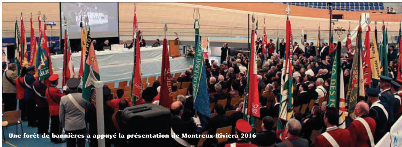
Une forêt de bannières a appuyé la présentation de Montreux-Riviera 2016