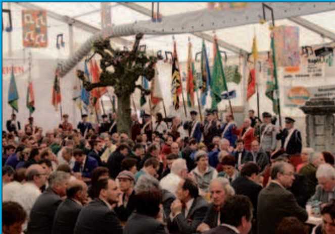
Le gymkhana des porte-drapeaux !

L'hymne vaudois (magnifiquement accompagné par une fanfare... fribourgeoise, en l'occurrence le brass-band «La Lyre» de Courtion, dirigé par Dominique Morel) étant entonné et les salutations d'usage effectuées, il était temps de passer aux choses sérieuses !