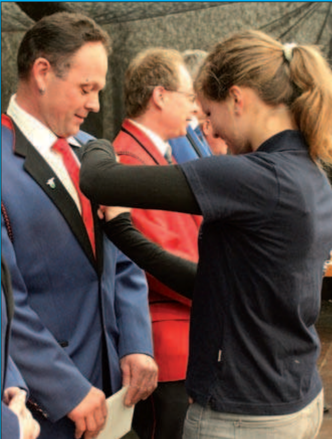
On s'applique au moment de piquer...