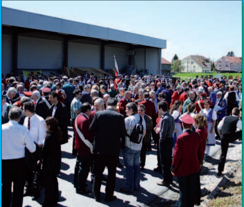
Apéritif sous le soleil à la fromagerie de Grandcour