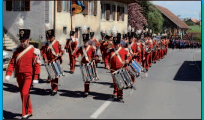
Le cortège, emmené par la Lyre de Courtion