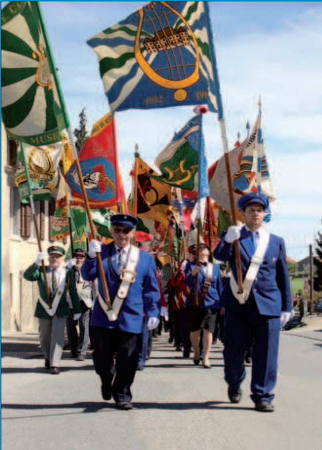
De fiers bannerets...