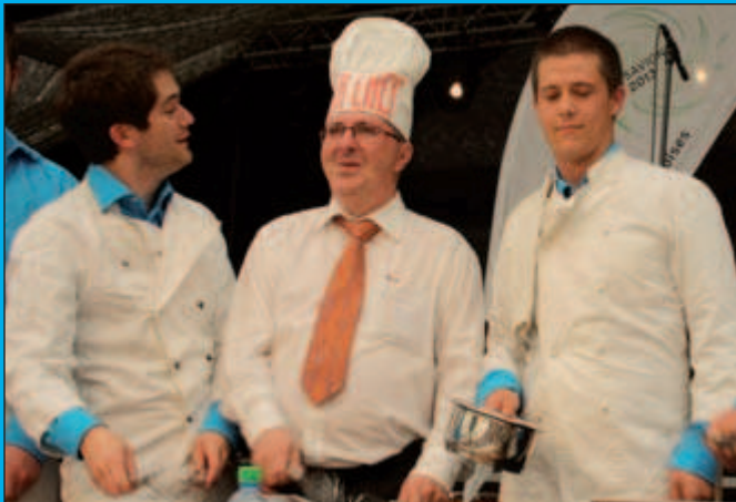
Le «Master Chef» de la SCMV aux fourneaux!