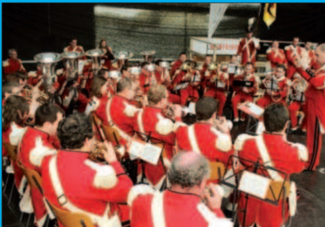
La Lyre paroissiale de Courtion, fanfare invitée