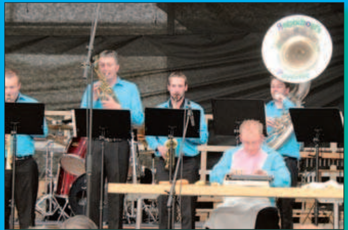
La «Pyramide grecque» s'y connaît pour mettre de l'ambiance!

Toutes les photos de cette journée sont disponibles sur www.scmv.ch !