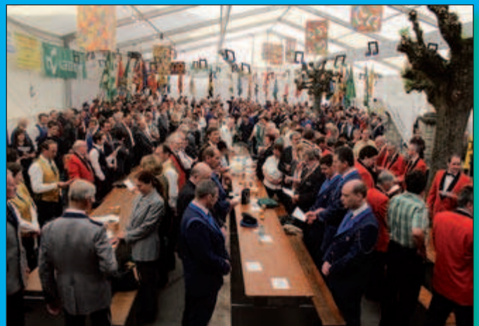
Visages solennels au moment d'entonner l'hymne vaudois