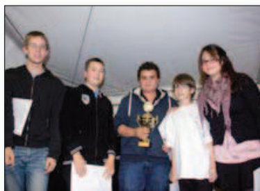
La superfinale percussion