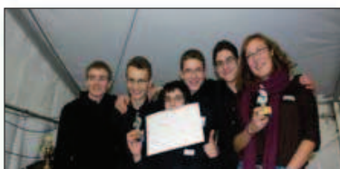
Cat. I/E : 1. Pully Brass (Corps de musique Pully), 2. Octocla (La Lyre Echallens), 3. Zut de Flûtes ! (EM Nyon)