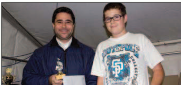
Cat. T/BA : 1. Tambours de Gilly-Bursins (Fanfare), 2. Etoy (Fanfare municipale)