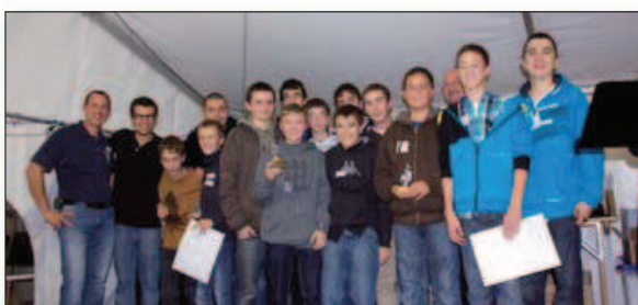
Cat. T/E : 1. Ecole de musique de Nyon, 2. Les Tirebouchons (La Lyre Avenches), 3. Les Guisiki (Fanfare municipale Aigle)