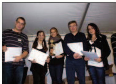
La superfinale bois