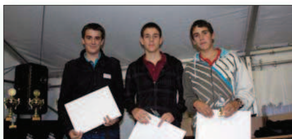
Cat. T/F : 1. Etoy (Fanfare municipale), 2. Aclens (L'Avenir), 3. Fanfare de St-Livres