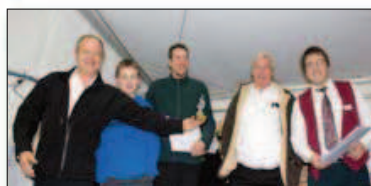
Cat. I/F : 1. Eupho Quartett St-Triphon (La Concordia St-Triphon), 2. Les Grau's Brass (Fanfare municipale Aigle)