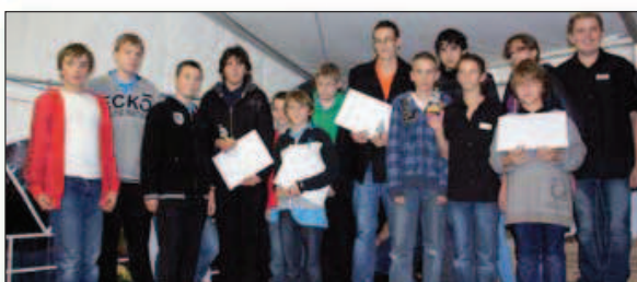
Cat. P/E: 1. Chicken Allegro (EM Rolle et environs), 2. Bras Cassés (Fanfare Crissier), 3. G.Vetro Prex (Fanfare la Verrerie St-Prex)