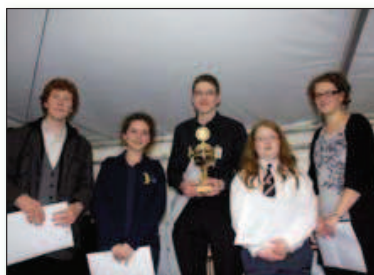
La superfinale cuivres