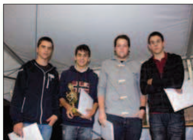
La superfinale batterie

NB: tous les résultats des podiums sont mentionnés au complet, sans tenir compte des éventuelles absences de concurrents lors de la cérémonie de remise des trophées. STN